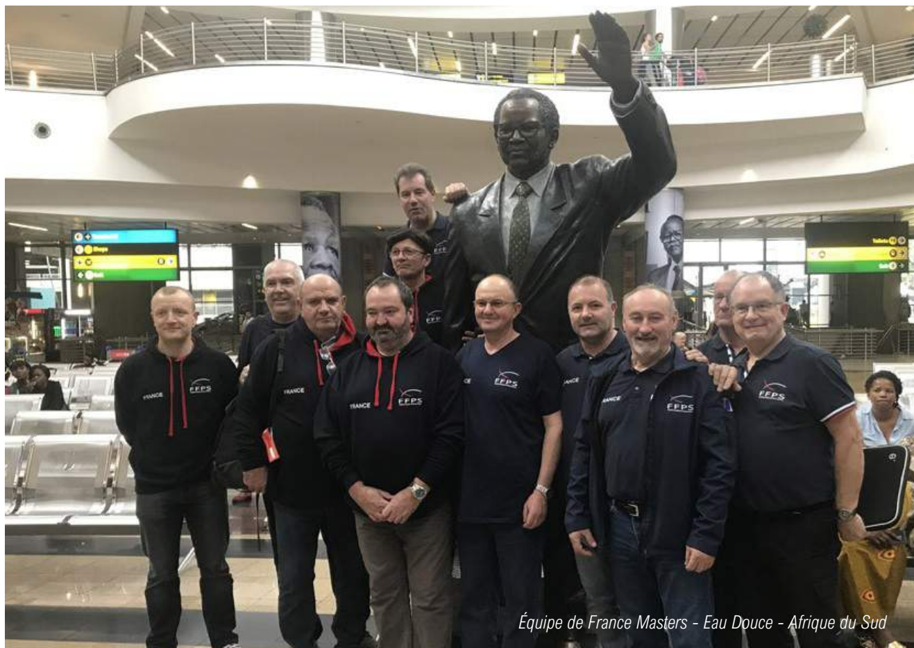
Équipe de France Masters - Eau Douce - Afrique du Sud