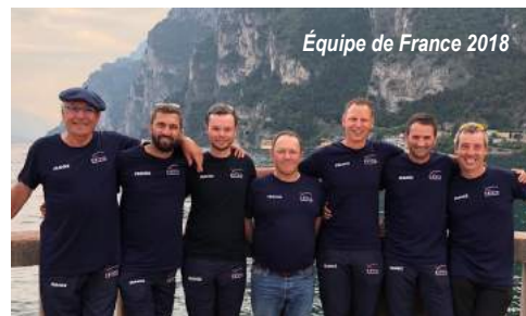
Équipe de France 2018

< Mouche libre : une seule règle à respecter : la longueur totale de l'imitation qui devra être comprise entre 1 et 3 cm.