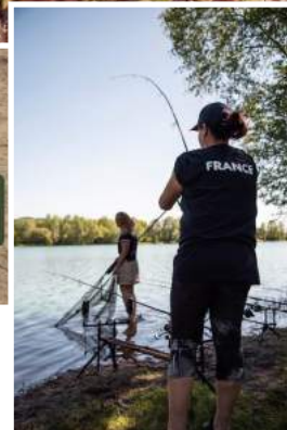
Equipe de France Féminine Carpe 2019 à l'entraînement