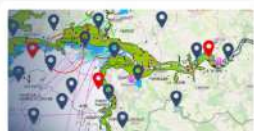
Coins de pêche

... Et bien plus encore à découvrir sur le site !