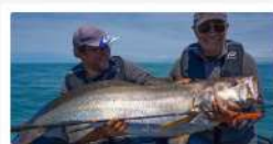
Guides de pêche