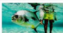
Voyages de pêche