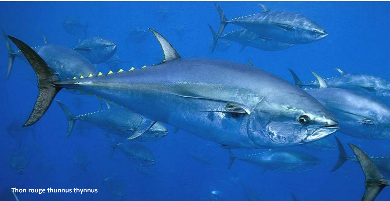
Thon rouge thunnus thynnus

La pêche sportive Big Game "au gros" est une pêche d'équipe se pratiquant en général assez loin des côtes, elle nécessite un minimum de connaissances et de préparatifs. Depuis une dizaine d'année, l'engouement pour cette pêche se généralise.