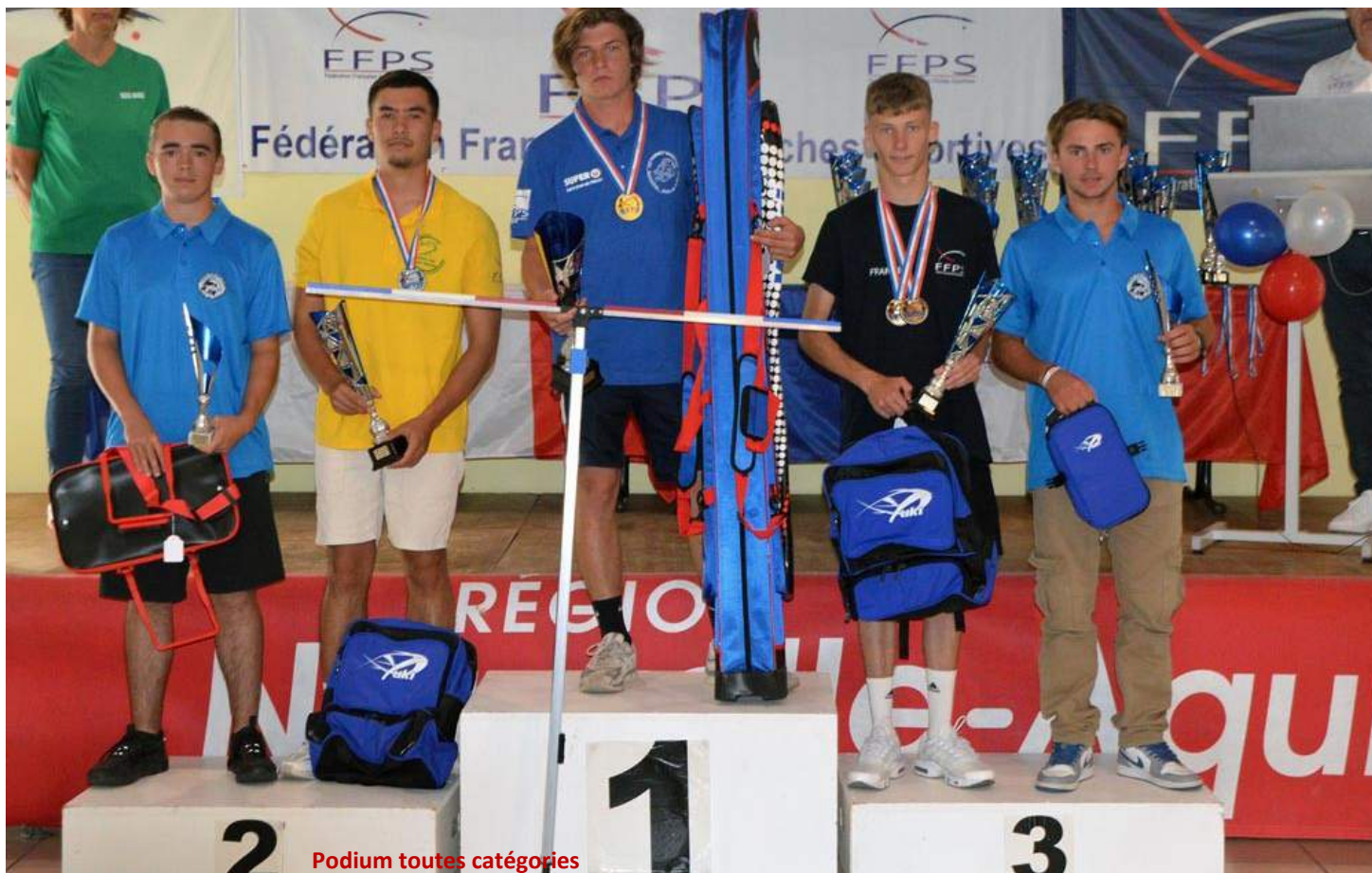
Podium toutes catégories

Le Surf Casting Club de Bias s'est vu confier l'organisation du 32ème Championnat de France Jeunes de Pêche en Bord de Mer et de Lancer de Poids de Mer par la Fédération Française des Pêches Sportives. Cette manifestation a regroupé 89 compétiteurs âgés de 6 à 18 ans venant de Bretagne, de Corse, des Pays de la Loire, des Hauts-de-France et bien évidemment de la Nouvelle-Aquitaine. Rappelons ici qu'il s'agit du plus grand rassemblement national de jeunes pour l'ensemble de notre fédération toutes disciplines et commissions confondues.