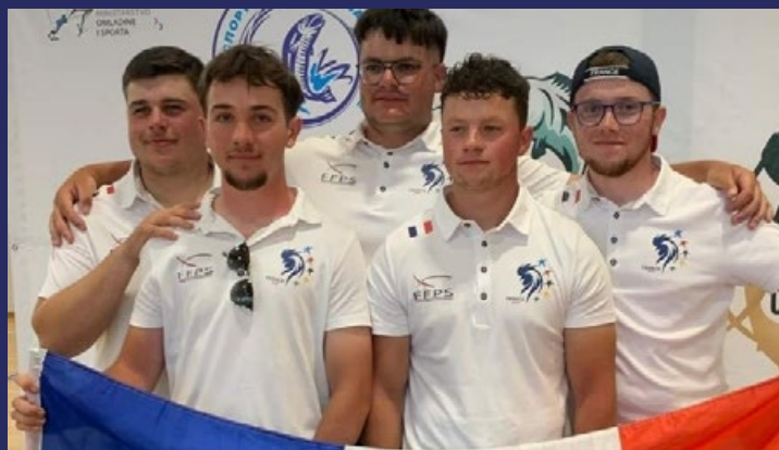
Équipe de France U20

Malgré tous ces efforts et à cause du vent défavorable, la pelouse aquatique est toujours restée intacte, obligeant, après un vote des capitaines, à l'annulation de la seconde manche pour les U15 et les U20.