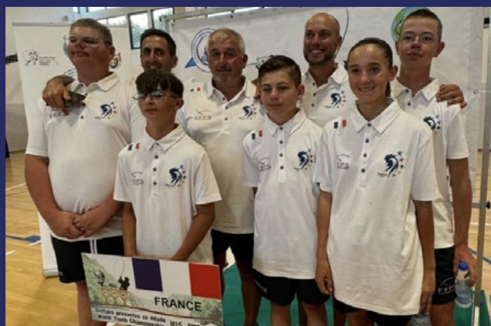
Équipe de France U15

Une impressionnante couche de lentilles d'eau était présente sur l'ensemble des secteurs. Si elle était difficilement maîtrisable lors des entraînements et de la première manche, elle l'était encore moins le samedi, lors de la deuxième manche. Des retards, des arrêts, des barrages, des passages de bateaux, des ramassages à l'épuisette, le tout dans une totale incompréhension et une pagaille monstre !