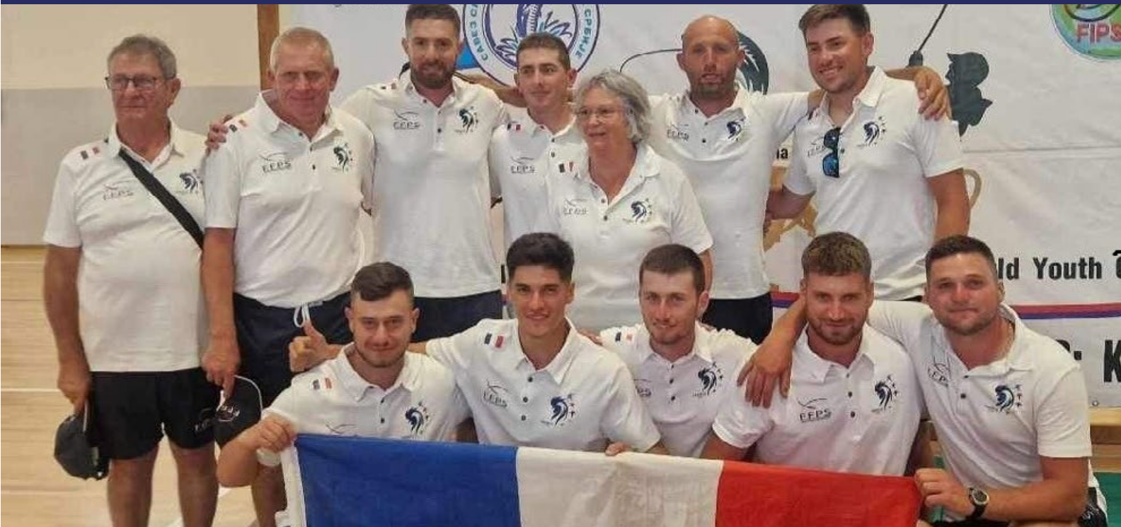
Équipe de France U25